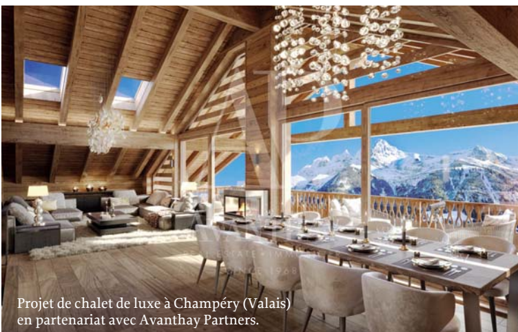
Projet de chalet de luxe à Champéry (Valais) en partenariat avec Avanthay Partners.

Concernant le développement immobilier, Logipro intervient comme direction générale du projet et pilote la définition des objectifs, les études préliminaires, l'étude du projet, l'appel d'offres, la réalisation de l'ouvrage jusqu'à sa mise en service. L'objectif est toujours le même: livrer une qualité promise, selon l'agenda établi, au prix convenu. Pour finir, Logipro réalise des constructions individuelles, chalets ou villas de qualité de finitions supérieures, bien souvent synonymes du rêve d'une vie. Les étapes sont nombreuses. La société y répond en mettant à disposition son expertise et son réseau et accompagne chaque client de la première rencontre à la remise des clés. Elle propose à ses clients des offres forfaitaires clé en main, ce qui assure au maître d'ouvrage un prix garanti depuis la signature du contrat d'entreprise jusqu'à la livraison de l'ouvrage. En période d'inflation galopante ceci est un atout indéniable qui séduit la clientèle.