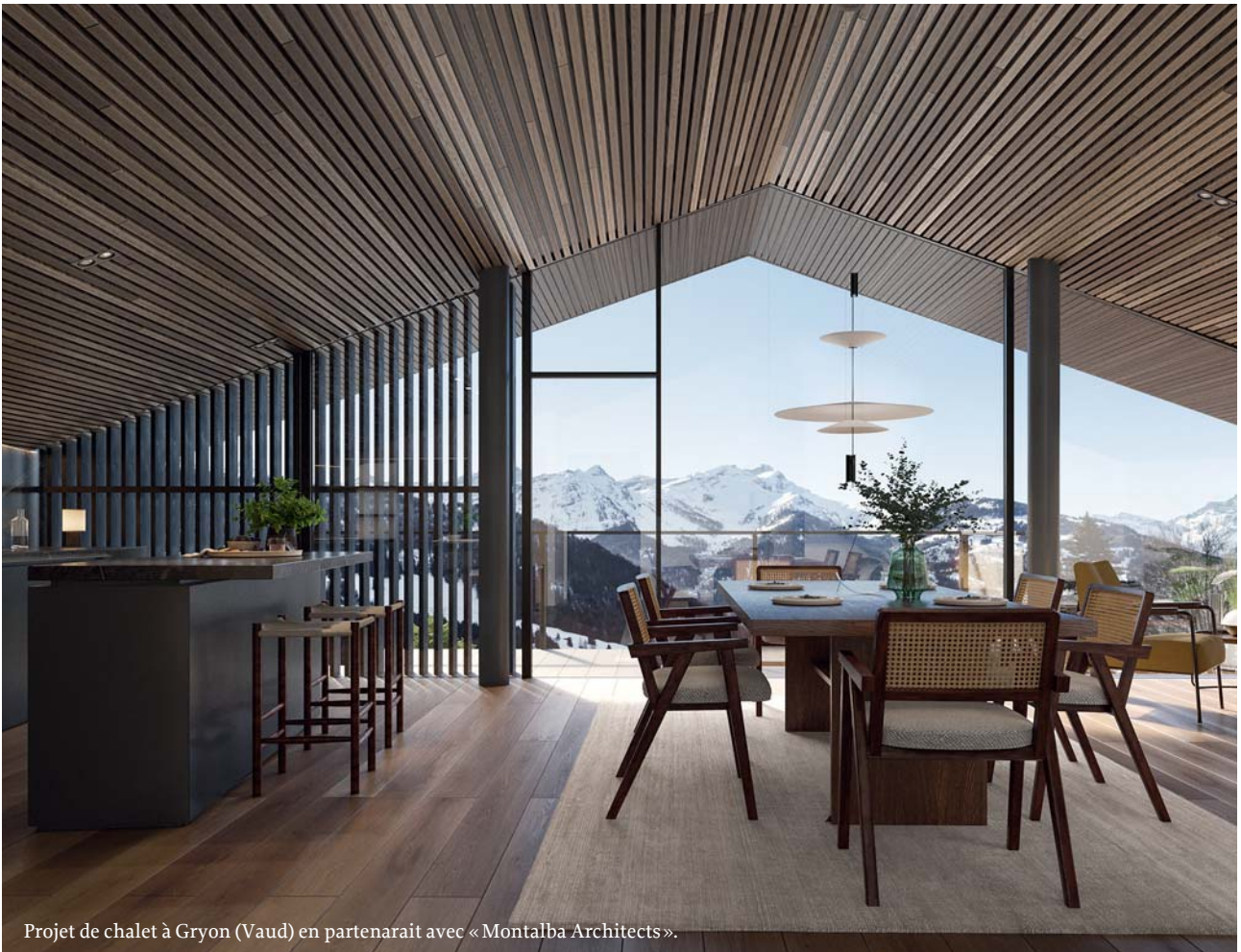
Projet de chalet à Gryon (Vaud) en partenariat avec « Montalba Architects ».

Pour une construction individuelle, un développement immobilier ou une promotion immobilière, Logipro, installée à Val-d'Iliez, a toutes les compétences nécessaires au succès de chaque projet. La société fournit des prestations d'une qualité irréprochable, ce qui a fait sa renommée et lui vaut d'être à l'origine de nombreux chantiers réalisés en Suisse romande.